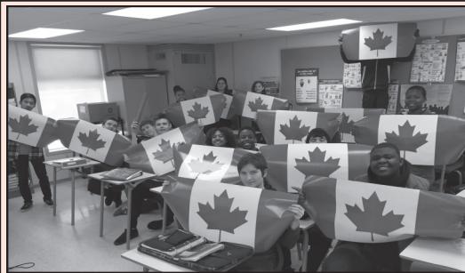
Des élèves de l'école secondaire Lester B. Pearson tiennent des affiches du drapeau

Nous n'avons pas souvent la chance de fêter des anniversaires importants, mais le 50 e anniversaire du drapeau canadien méritait d'être célébré!